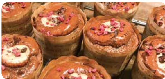
しっとりもちもちの米粉マフィン。豆乳を使ってよりヘルシーに！ココアをたっぷり入れて、チョコレート風味にしています。

米粉の良さを生かしたスイーツ作りが成功の秘訣。小麦粉のパンと同じように作れることが必ずしも良いわけではありません。シフォンケーキやホットケーキは、しっとりもちもちとして米粉の良さがよく出ています。チーズケーキやブラウニーのように、目が詰まってどろりとした感じのケーキは簡単に代替できます。