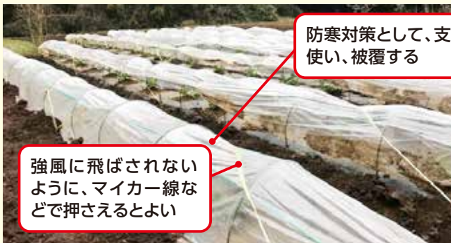
防寒対策として、支柱を使い、被覆する

連作を行うと感染リスクが高まるので、土壌消毒を付けた前に行うか、同一圃場での栽培はできれば5年以上(最低でも1年)空けて行いましょう。また、播種時または定植時にアドマイヤー1粒剤を処理し、年内にアブラムシが発生するようにであれば、追加で消毒を行います。気温が上昇する頃にアブラムシが発生するので、発生前に予防することが重要です(表①参照)。