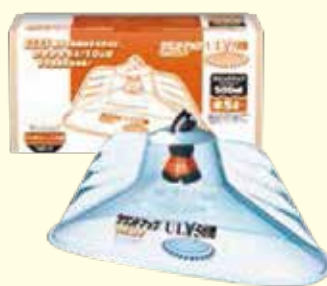
ラウンドノズル®ULV5セット バッテリー・人力用