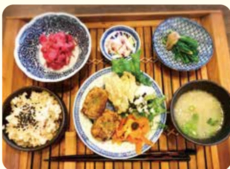
小麦粉を一切使わず、発酵食を使って作るビーガン食の献立例

さらに、日本の食文化から見ると、米(米粉)に足りない栄養が、みそなどの大豆発酵製品と一緒に摂取することで、パーフェクトに近い状態になることに、先人の知恵を感じます。