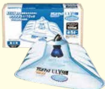
ラウンドノズル®ULV5セット 動力用