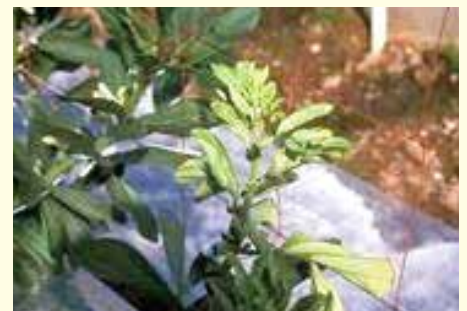
写真③ ソラマメの萎黄病