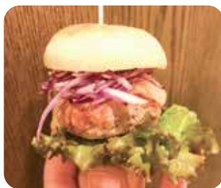
米粉100%で作ったパンにハンバーグ(お肉のつなぎに米粉を入れたもの)を挟んだミニバーガーです。