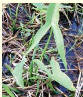
写真⑤ 稲刈り後に再生したオモダカ

● オモダカ(写真⑤) 矢じりのような葉を形成し、くちばしのような芽を持つ塊茎から発生します。土中の寿命は約1年ですが、適当な乾燥条件に置かれた場合は、数年生存します。