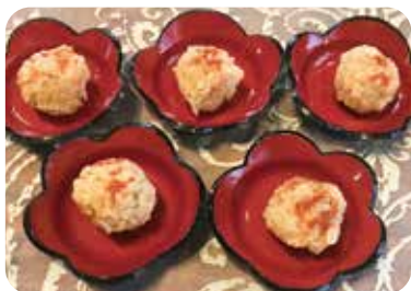
おからを使った具を丸めて、米粉の溶き粉にくぐらせ、玄米フレークを砕いてパン粉代わりに付けて、油でからりと揚げたコロッケです。

小麦粉と比べて吸油率が低い(油を吸い込みにくい)のでヘルシーな上、でんぷんの特性で少ない水分量で調理すると硬くなるため、揚げ物がカリッと仕上がります。また、時間がたっても衣がしんなりしないので、おいしさが持続します。料理の腕がなくても、カリカリサクッとおいしい揚げ物ができるなんてうれしいですね。